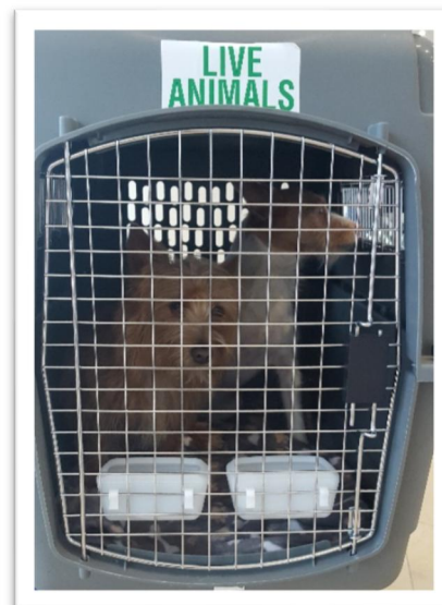
Två glada podengos utcheckade efter flygningen